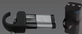
Mottagare/Sändare Uppladdningsbart batteripack