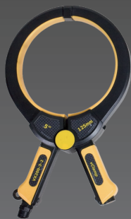
50mm, 100mm, 125mm sizes Sändartänger